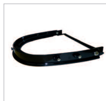
CARRIER UNIVERSAL Ref. 79174B Soporte carrier universal para acoplar visores a cascos. Válido para todos los modelos. (Ver p. 38).

Visor de malla: Ref. 79505 Para el acople del visor será necesario usar el soporte: Ref. 79745 y dos brackets (Ref. 79746). (Ver p. 39).