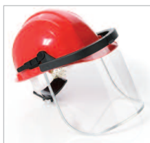
SUPERFACE COMBI Ref. 79710 Protector facial para uso con cascos. Incluye el soporte y los brackets. Se puede colocar en posición de visera. Ofrece protección contra partículas y contra gotas o salpicaduras de líquidos (símbolo 3). (Ver p. 36).