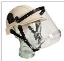
FACEMASTER COMBI Ref. 79209 Protector facial para uso con cascos. Incluye el soporte y los brackets. Conjunto formado por: soporte de acoplar a casco; brackets para soporte; visor de policarbonato preformado; y pieza cubre barbilla. (Ver p. 37).