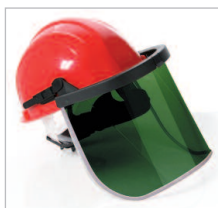
SUPERFACE COMBI GREEN Ref. 79715 Protector facial verde DIN 5 con aro de aluminio, para acoplar a cascos. Incluye el soporte y los brackets. Se puede colocar en posición de visera. Ofrece protección contra partículas y contra gotas o salpicaduras de líquidos (símbolo 3). (Ver p. 36).