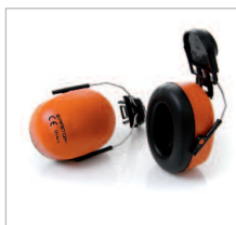
SONICO SET Ref. 82305 SNR 29DB Protector auditivo para uso con cascos. Una vez colocado puede abatirse, quedando el casco en su posición. Ajustable personalmente en altura. Válido para largos períodos de uso. Copas muy suaves para mayor confort. (Ver p. 95).