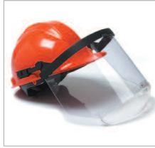
PERFO COMBI AC Ref. 79600 Conjunto para aplicaciones industriales por su combinación de protección facial y de cabeza. Formado por un visor antivaho de acetato acoplado a un soporte abatible. Resistencia al calor 125°C. Con resistencia química. (Ver p. 37).