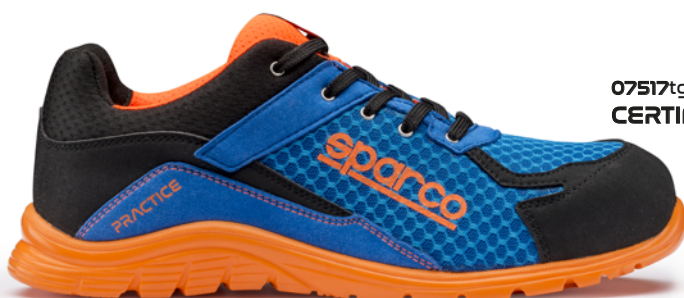
07517tgAZAF CERTIFICAZIONE S1P