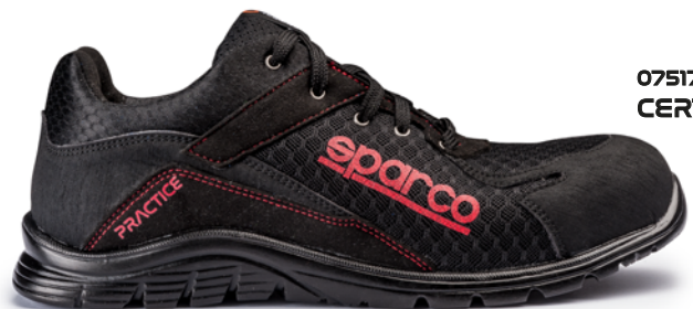
07517tgNRNR CERTIFICAZIONE S1P