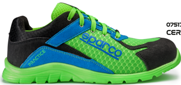
07517tgVFA2 CERTIFICAZIONE S1P