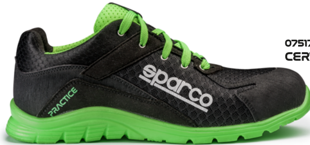
07517tgNRVF CERTIFICAZIONE S1P