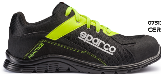
07517tgNR6F CERTIFICAZIONE S1P