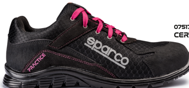
07517tgNRFU CERTIFICAZIONE S1P