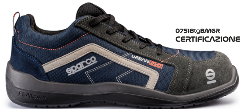
07518tgBMGR CERTIFICAZIONE S1P