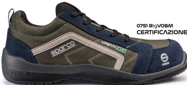
07518tgVOBM CERTIFICAZIONE S1P