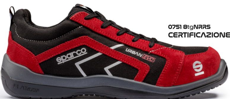
07518tgNRRS CERTIFICAZIONE S3