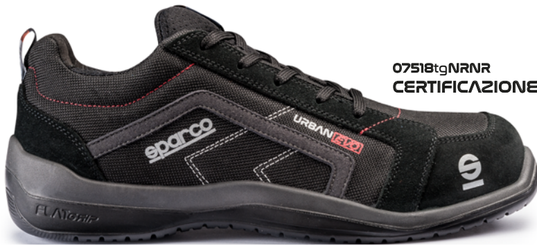
07518tgNRNR CERTIFICAZIONE S1P