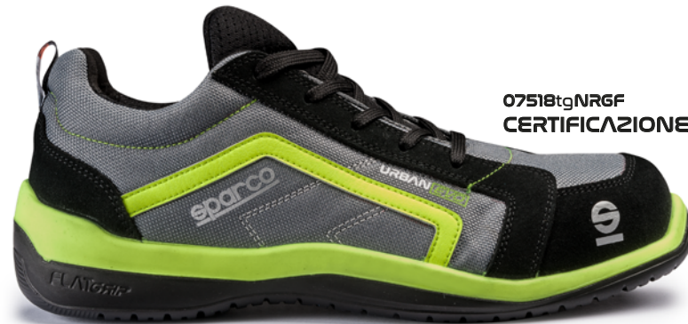
07518tgNR6F CERTIFICAZIONE S1P